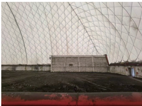
图 2 气膜煤场(全封闭)

气膜煤场是一种真正意义上的全封闭环保煤场, 其采用高强度柔性薄膜材料, 利用空气压力支撑膜体来实现大跨度储煤空间, 如图 2 所示。与传统钢结构煤场相比, 具有如下明显的优势: 建设造价和后期