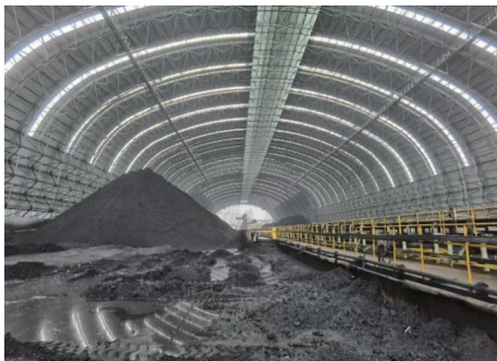
图 1 钢结构煤场(无法实现全封闭)

钢结构封闭煤场在国内燃煤电厂中应用广泛, 主要结构形式有曲面钢网架结构或预应力钢索结构, 如图 1 所示。钢结构煤场具有结构安全、外形美观、技术成熟等优点, 但其存在最大问题是不能实现煤场全封闭, 特别是在大风和台风天气时容易造成煤尘飞扬, 污染环境, 还有台风时会造成严重的彩钢板风掀起事故引发次生伤害。由于不能全封闭, 面临环保督察“回头看”检查不达标风险。此外, 钢结构煤场封闭存在造价高、施工安全风险大、建设周期长, 后期对于智能煤场建设存在一定限制。