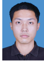
CAI J T