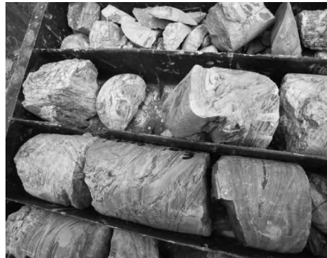
图2 钻孔中泥页岩揉皱现象

场地中志留系下统连滩群地层发生了不同程度的浅变质作用,从地表至深部,均有不同程度的变质作用,随深度加深,变质作用加强。根据岩矿鉴定成果,砂岩成分主要为石英(65%~90%)、水云母及绢云母(5%~25%);泥质粉砂岩主要为石英(60%~70%),水云母及绢云母(25%~30%);