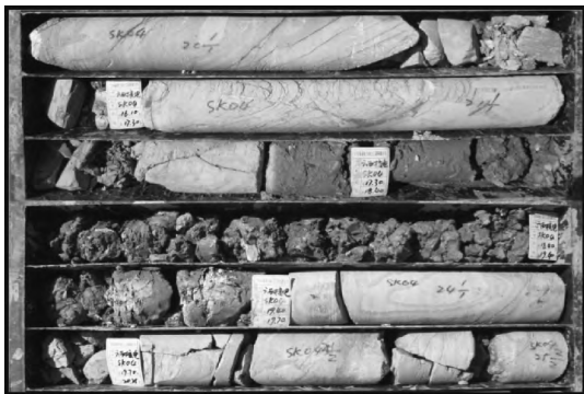
图4 钻孔中揭露的岩体差异风化情况

由于上述原因,核岛区差异风化作用明显,钻孔中强风化层和中等风化层交替出现的现象较为普遍,上部以强风化层为主,夹中等风化层;中部以中等风化层为主,夹强风化层;下部主要为中等风化层和微风化层,不均匀风化夹层的产状与地层产状基本一致。