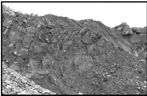
图1 褶皱中各岩层厚度变化情况

由于层厚和岩性的不同,褶皱发生过程中,抗塑性变形能力较强的中厚层砂岩为褶皱中的能干层,在褶皱的各部位层厚变化不大,局部厚层泥质粉砂岩及泥页岩中的薄层砂岩,在褶皱等地质构造过程中,由于泥质粉砂岩及泥页岩揉皱、扭曲等变形幅度较大,使薄层砂岩在周围软岩大幅度变形影响下,发生脆性变形,产生“弯断”现象。泥质粉砂岩、泥页岩受强烈挤压作用下,常发生塑性变形,发生塑性变形的物质逐渐由受挤压的翼部向扩张的核部流动,即弯流作用。因此钻孔岩芯中泥、页岩多见流纹状纹理,在褶皱翼部泥质粉砂岩、泥页岩夹层较薄或缺失,在核部厚度相对增大且发生强烈揉皱。