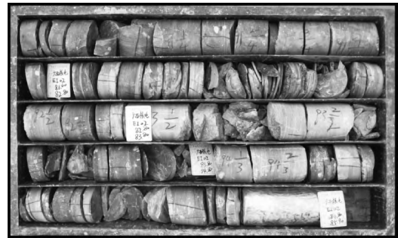
图3 钻孔中所揭露的泥岩、页岩板岩化

泥页岩主要为石英(10%~30%),水云母及绢云母(60%~90%)。三种岩类变质矿物主要为水云母及绢云母,且由砂岩-泥质粉砂岩-泥页岩水云母及绢云母含量逐渐增加,说明变质程度也逐渐增强,但变质作用并不彻底,因此泥质粉砂岩及泥页岩多为变余结构、构造,以隐晶质为主,原岩层理已发生变化,表现为板岩化或千枚岩化,见图3钻孔中所揭露的泥岩、页岩的板岩化。